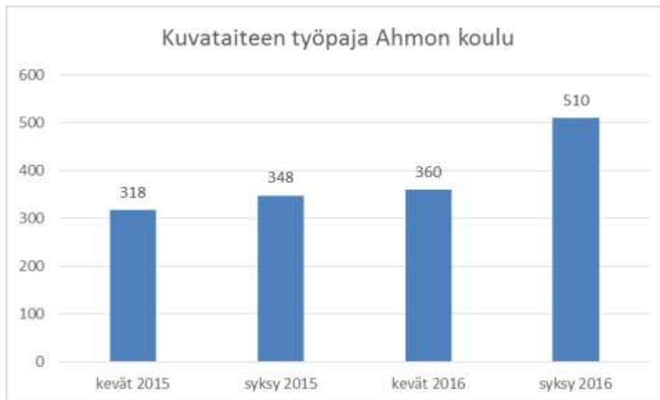
Kuvataiteen työpajan osallistumistuntien määrän kehitys 2015 - 2016